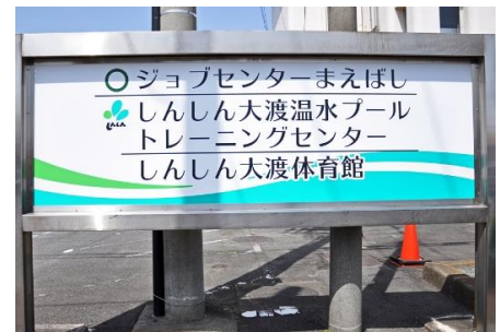
施設入口の案内板