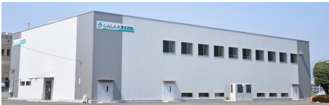
しんしん大渡体育館全景

床面積：1,119平方メートル バスケットボールコート2面（公式用は1面）、卓球台4台有り 観覧席：常設無し 駐車場：（約200台※プール利用者用兼用） 開催行事等：バスケットボール、バレーボール、卓球、バトミントン、剣道大会 他