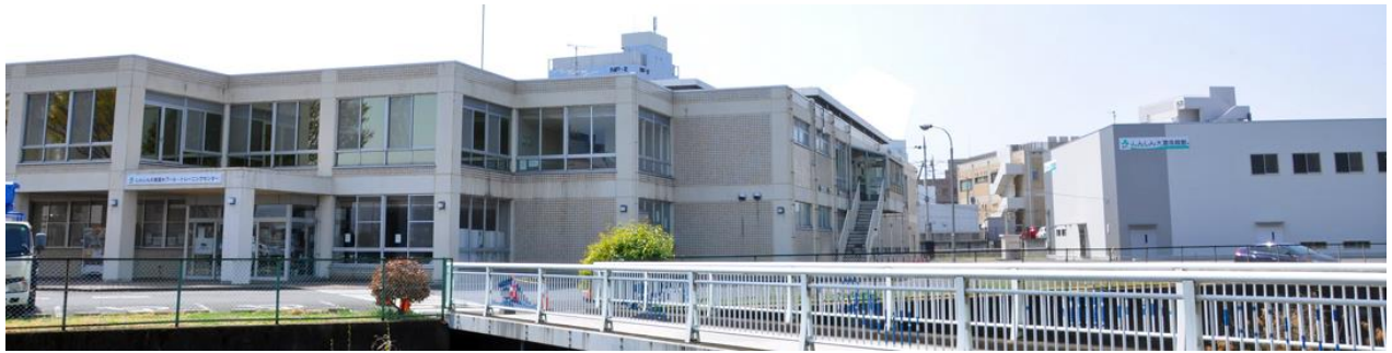
しんしん大渡温水プール・トレーニングセンター（左建物） しんしん大渡体育館（右建物）

2020年暮れに前橋市が募集した各種施設のネーミングライツ（愛称命名権）につきまして、弊社は「大渡体育館、大渡温水プール・トレーニングセンター」のネーミングライツを取得いたしました。この施設は、体育館・温水プール・スポーツジムなどを擁するスポーツ関連施設としては複合的で利用者も多いところです。