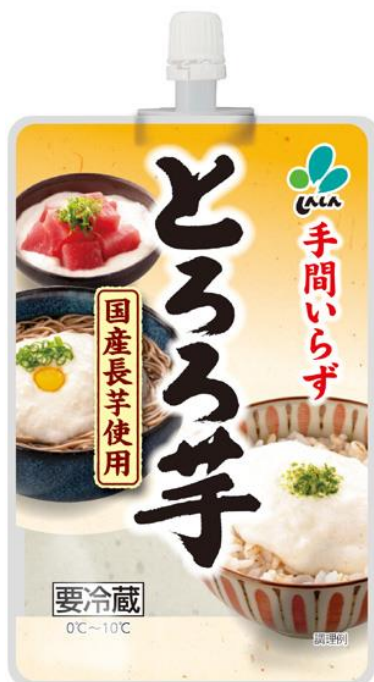
手間いらずとろろ芋 千人当たり金額推移 日経POSデータ

来店客千人当たり販売金額の前年度伸び率、店舗カバー率、日経商品分類(2000分類)内順位、メーカー別伸び率など4つの指標で一定基準を上回る420商品を選出。そのうち上位10製品をプレミアム賞、50製品をゴールド賞、360製品がセレクションとして選出されました。